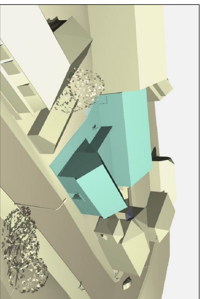
Vaade 1. Linnulennult