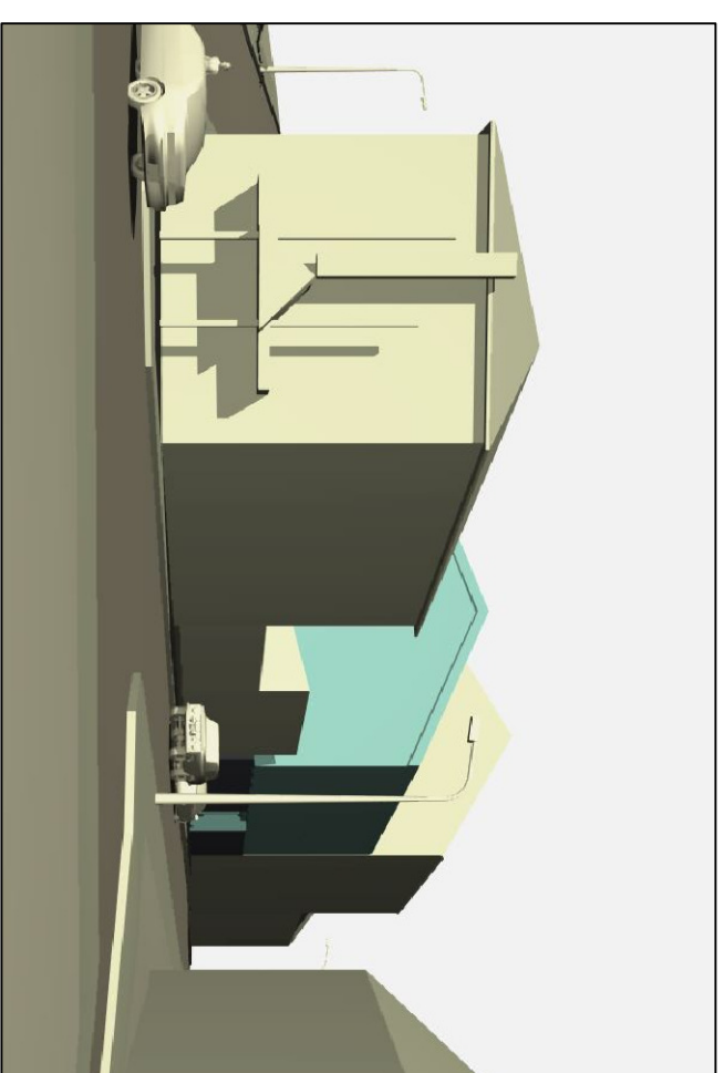
Vaade 3. Tähtvere tänava poolt